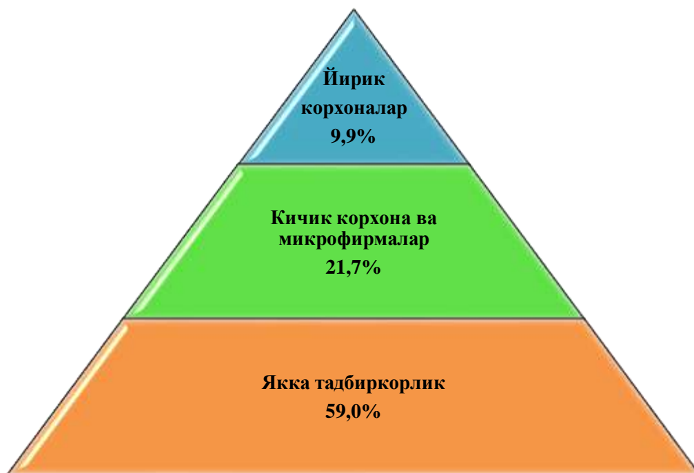
Чакана савдо товар айланмаси таркиби (2018 йилнинг январь–март ҳолатига фоизда, уюлмаган савдосиз)

2018 йилнинг январь–мартда чакана савдо товар айланмаси таркиби давлат ва нодавлат шакллари бўйича қуйидагича ифодаланади: нодавлат сектор мулки 2 303,7 млрд.сўмни ёки ўтган 2017 йилнинг шу даврига нисбатан 103,5 фоизни ва умумий чакана савдо товар айланмасидаги улуши 100,0 фоизни ташкил қилди.