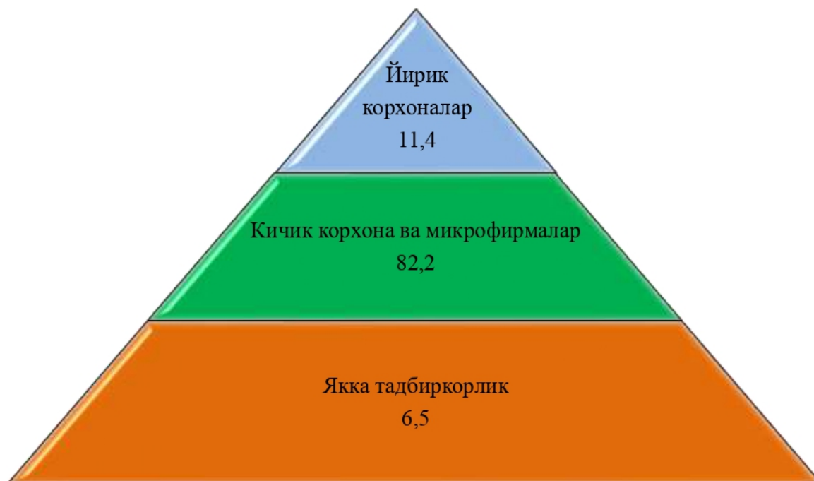
Чакана савдо товар айланмаси таркиби (2020 йилнинг январь–сентябрь ҳолатига %да, уюшмаган савдосиз)

2020 йилнинг январь–сентябрида чакана савдо товар айланмаси таркиби давлат ва нодавлат шакллари бўйича қуйидагича ифодаланади: нодавлат сектор мулки 11 083,9 млрд. сўмни ёки ўтган 2019 йилнинг шу даврига нисбатан 96,7 %ни ва умумий чакана савдо товар айланмасидаги улуши 100,0 %ни ташкил қилди.