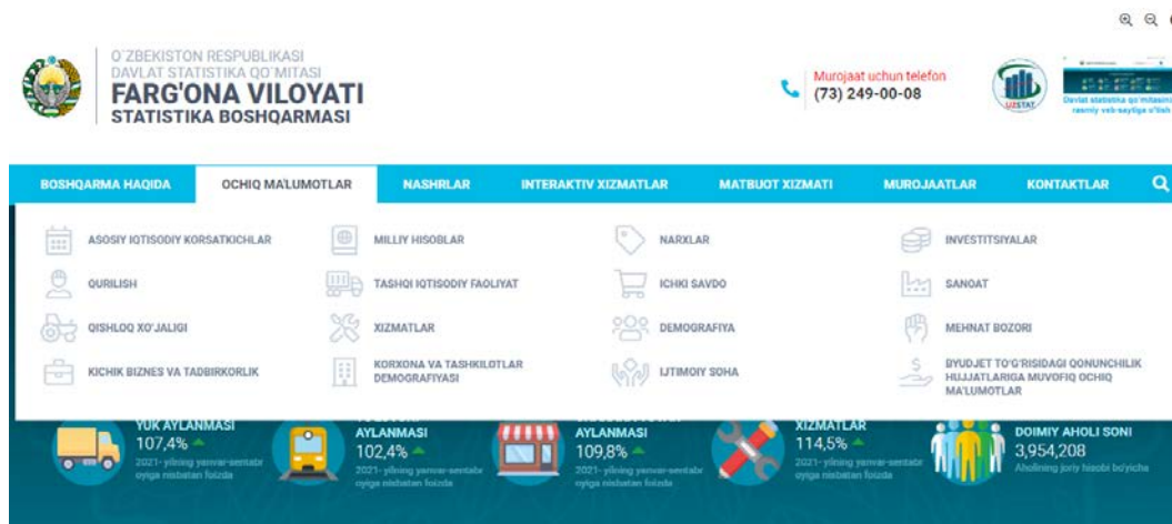
3-rasm. Ochiq ma'lumotlar oynasi