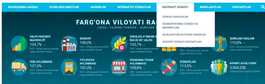
5-rasm. Matbuot xizmati bo'limi