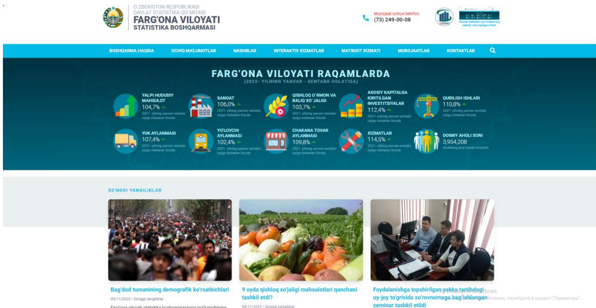
1-rasm. Asosiy sahifa

Asosiy sahifaga kirgandan so'ng foydalanuvchi saytdagi mavjud bo'limlardan o'zini qiziqtirgan barcha ma'lumotlarga kirishi, o'zini qiziqtirgan savollarga javob olishi mumkin.