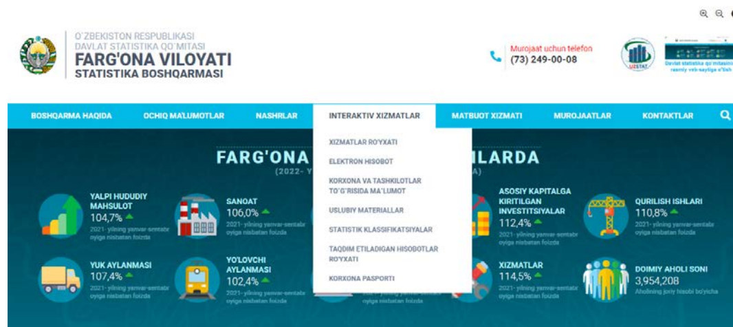
4-rasm. Interaktiv xizmatlar bo'limi

Ushbu bo'limda Statistika hisobotlar topshiradigan tadbirkorlik subyektlariga ma'lumot va yo'riqnomalar mavjud